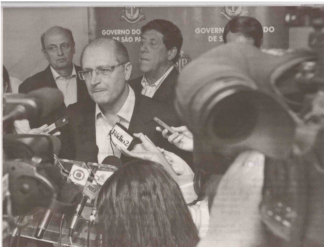
Governador anunciou novas unidades especializadas para a saúde e ainda 228 leitos para atender pacientes do Sistema Único de Saúde(SUS)