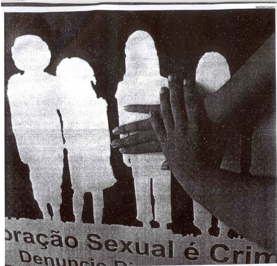
A Ong Meninos da Enseada venceu concurso da Petrobras pelo trabalho com crianças e adolescentes vítimas de exploração sexual e comercial